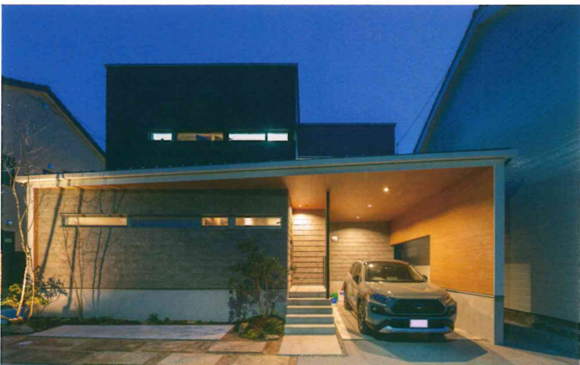
家屋と一体化させたビルトインガレージで、雨天時も濡れることがない動線を確保。木質感のある天井や壁面のガレージは室内のように上質。遮るもののないオープン外構が往来面に開口部を少なくすることでプライバシーもしっかりと保たれている