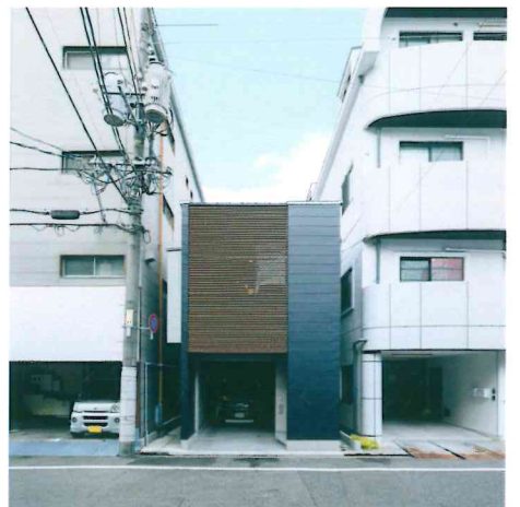
ビルに囲まれた24坪の狭小住宅は、防火地域の中、木造耐火基準で2階建てをクリア。スキップフロア設計を取り入れ、プライバシーを守りながら、中庭と明るい光が差し込む暮らしを実現している