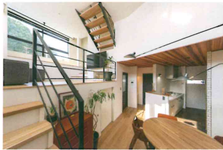
十分な平地の確保が難しく建築制限の多い都市の市街地などでは空間をより広く効率的に使うために間取りの工夫が必要になる。左写真では大きな窓を設え開放感のあるキッチン・リビングを実現。右写真は2階への途中をスキップフロアにし、その下には収納も設え豊かな空間をつくり出している