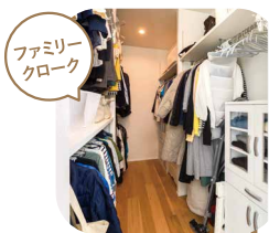
ファミリークローク

入りのしやすさ、洗濯機置場や物干しスペースとの動線を考慮して、使いやすい間取りを選びましょう。家事にゆとりができた分、家族が一緒に過ごす時間を楽しめたいですね。